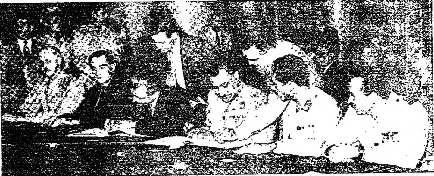
جمال عبد الناصر يوقع المعاهدة المصرية - البريطانية عام ١٩٥٤ التي أنهت الاحتلال البريطاني . ويبدو عبد الحكيم عامر ، وعبد اللطيف البغدادي